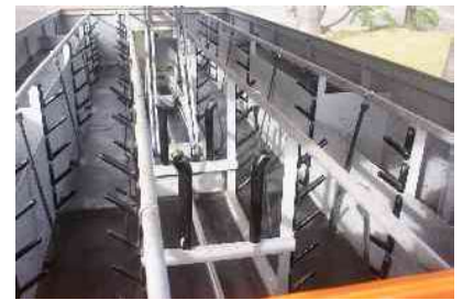
Rack para armazenagem das ferramentas